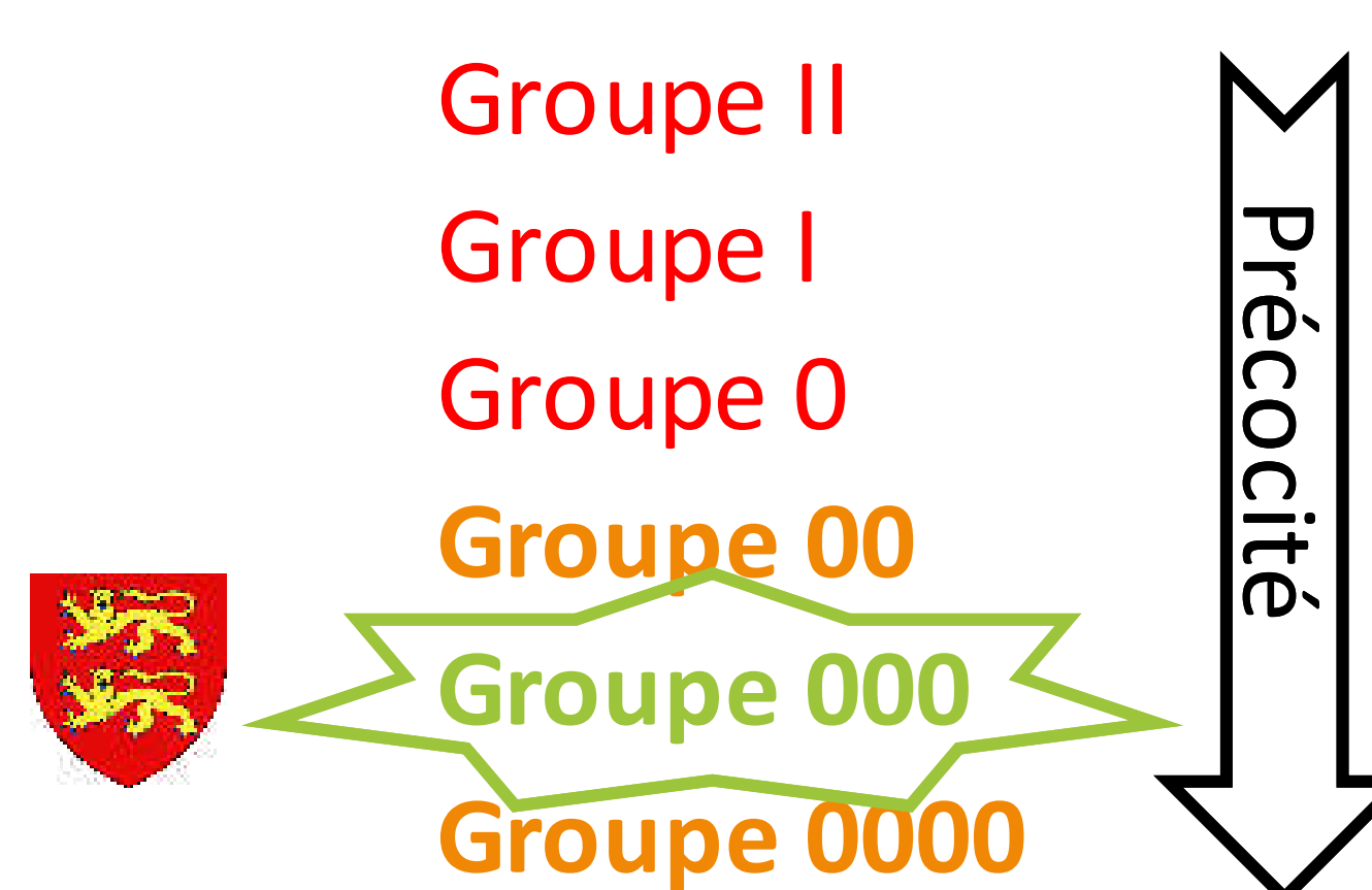
Essais menés à Epinay-sur-Odon en 2021 et reconduits