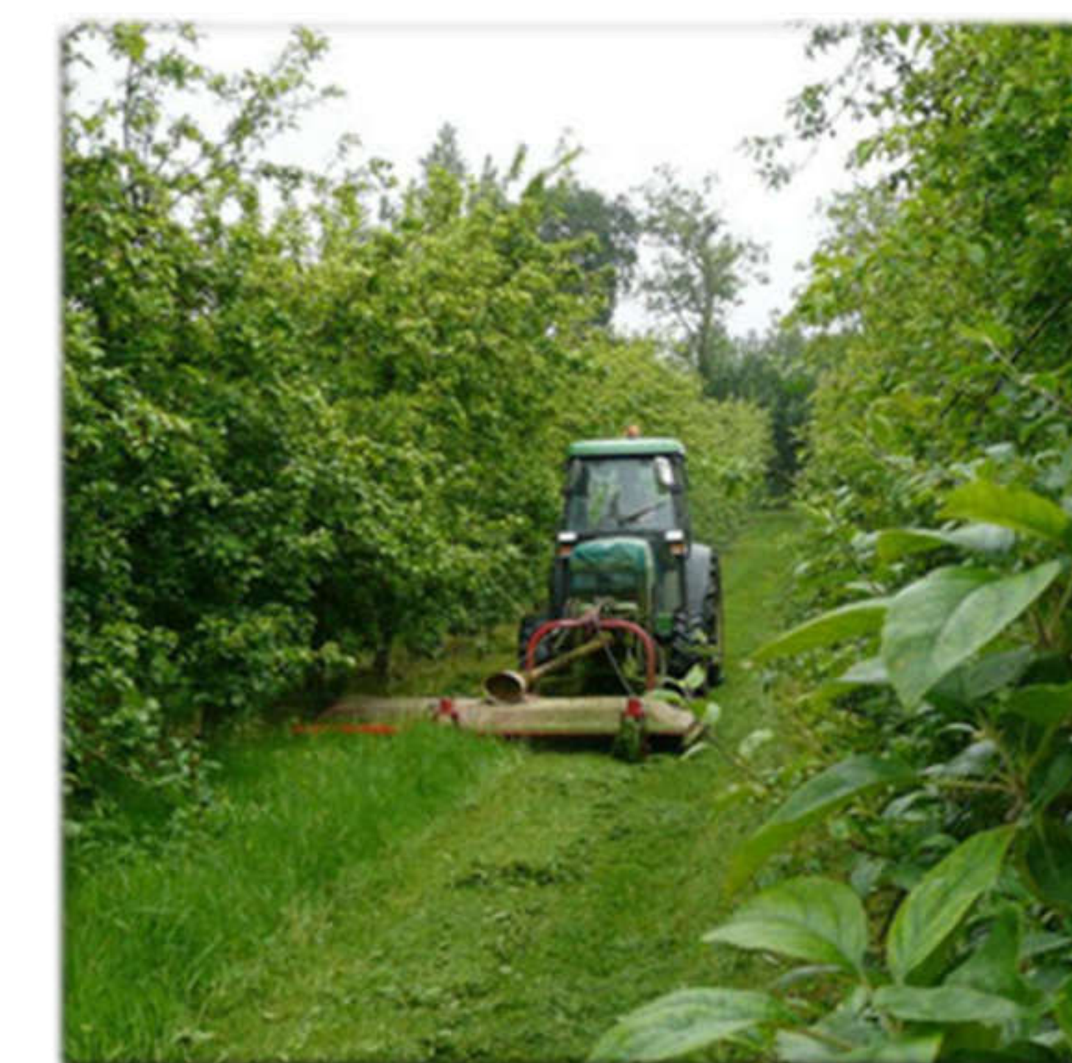
Le verger est enherbé en totalité